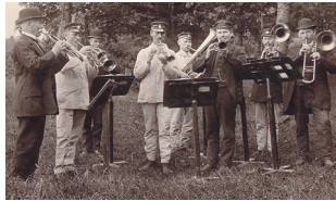
Sjukhusets blåsorkester år 1920.

Tisdag 26 april kl 17.30 Fotografier från Ulleråker – inblickar i en sluten sjukhusvärld Thérèse Toudert