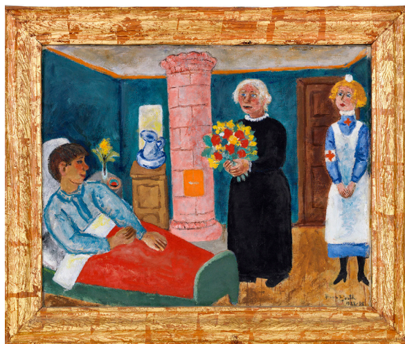
Sjukbesöket I. Målning av Bror Hjorth 1922–35.