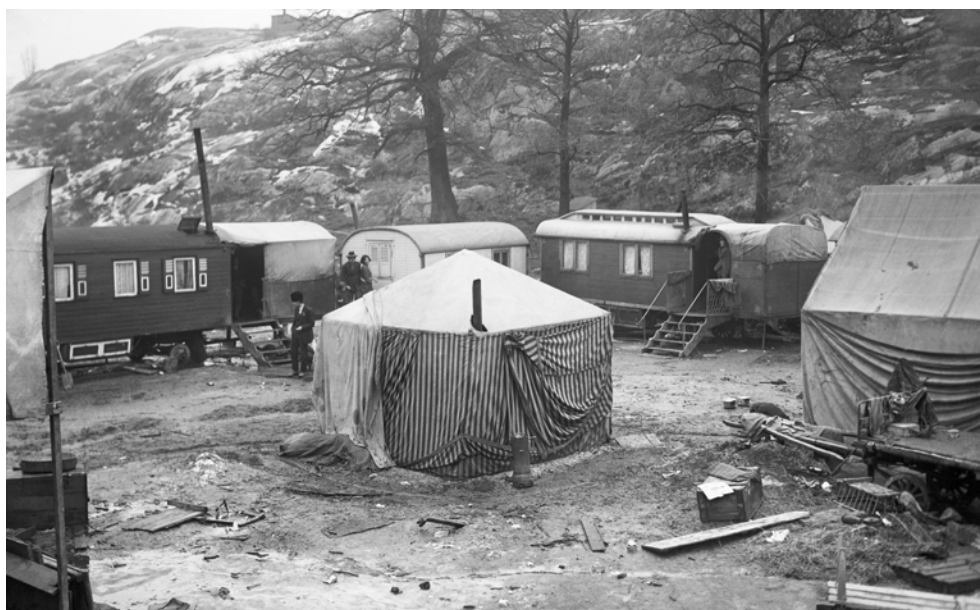
Foto från ett romskt läger i Gröndal, Stockholm, 1927.

I början av 1950-talet höjdes många röster i Sverige för att man måste förbättra romernas levnadsvillkor. Det gav resultatet att man 1954 bestämde att det skulle ordnas bostäder åt romer och 1959 att romska barn skulle få gå i skolan. Då fick romer även rösträtt i Sverige.