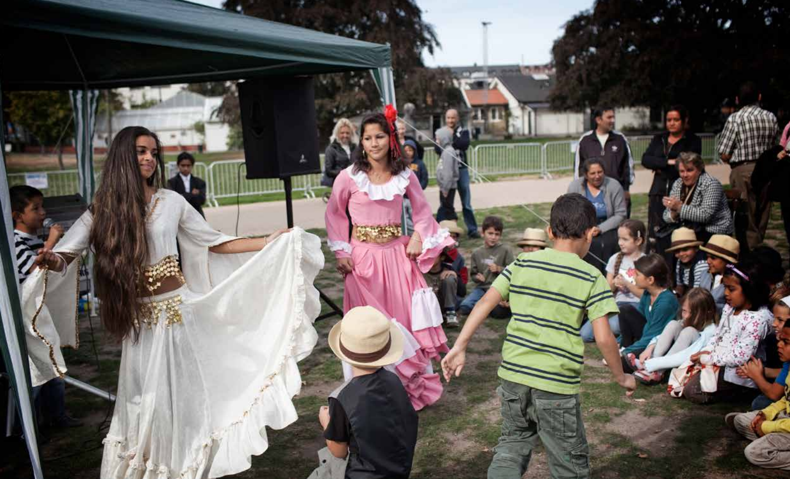
I Malmö Folkets park firas romsk kulturvecka med dans, sång och matlagning.

Romernas nationaldag firas den 8 april varje år. Man har en romsk flagga och det finns en nationalhymn som heter Gelem, Gelem (Jag har vandrat). På nationaldagen sjunger man nationalhymnen och hissar den romska flaggan.