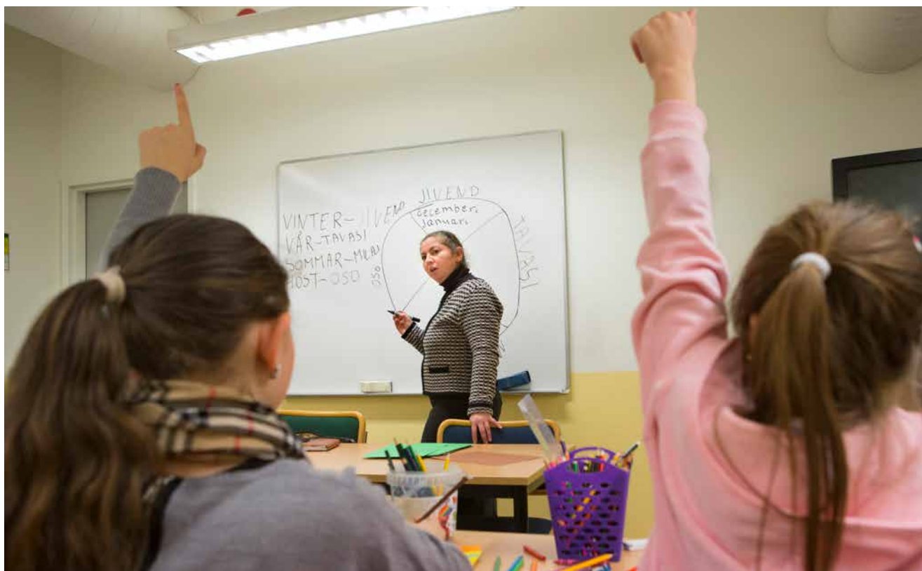
Modersmålsundervisning i romska pågår.

I skolan kan man få läsa romska som modersmål och man behöver inte kunna någon romska eller ha pratat romska hemma för att få modersmålsundervisning om man tillhör den nationella minoriteten romer. De nationella minoriteterna har också lite större rätt till modersmålsundervisning: om en elev i klassen vill ha undervisning, så ska skolan arrangera det. För övriga minoritetsspråk krävs att fem elever vill ha undervisning. Ett problem för alla minoritetsspråk är emellertid att det finns så få lärare som kan undervisa i dem.